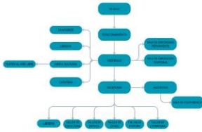
DIAGRAMA DE FUNCIONAMIENTO