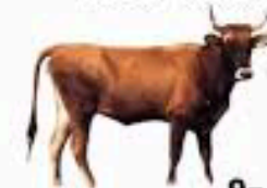
Bos taurus indicus