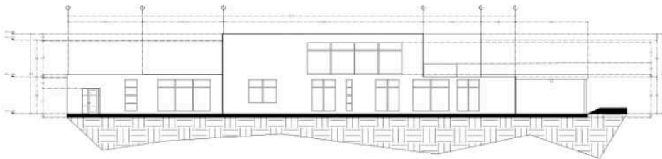
FACHADA LATERAL IZQUIERDA Escala: 1/200