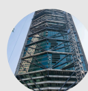
VIGAS Y LOSAS