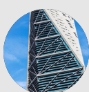
MUROS DE CONCRETO INCLINADOS