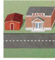
6. next to the bank