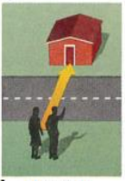
1. across the street