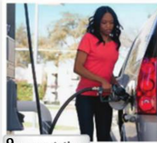
9. a gas station