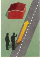
2. down the street