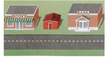
7. between the bookstore and the bank