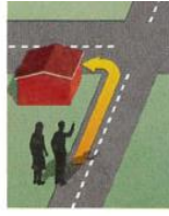
3. around the corner