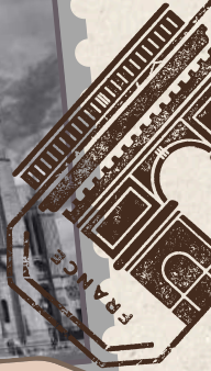
Catedral de Chartres