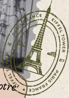
Catedral de Notre Dame