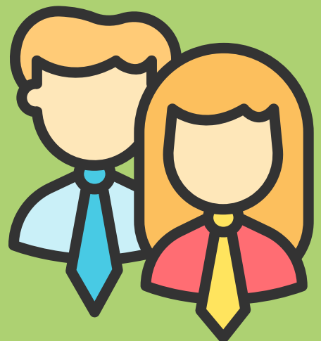
Imagen no verbal. Como ya se mencionó, el 93% del lenguaje, es no verbal, por tal razón, es conveniente preocuparse por la postura corporal que se está adoptando. El cuerpo constantemente está hablando.

Imagen verbal: Cada detalle es importante a la hora de proyectar una buena imagen. Saber enviar correctamente un mensaje sin errores de ortografía, tener una buena redacción, contestar adecuadamente el teléfono, hacer uso correcto de la etiqueta en internet.