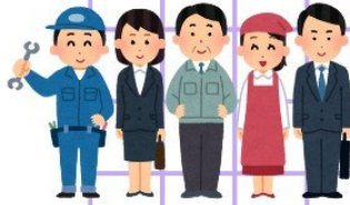
IMAGEN Y DESARROLLO DE SUS COMPONENTES.