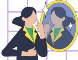
IMAGEN Y DESARROLLO DE SUS COMPONENTES.