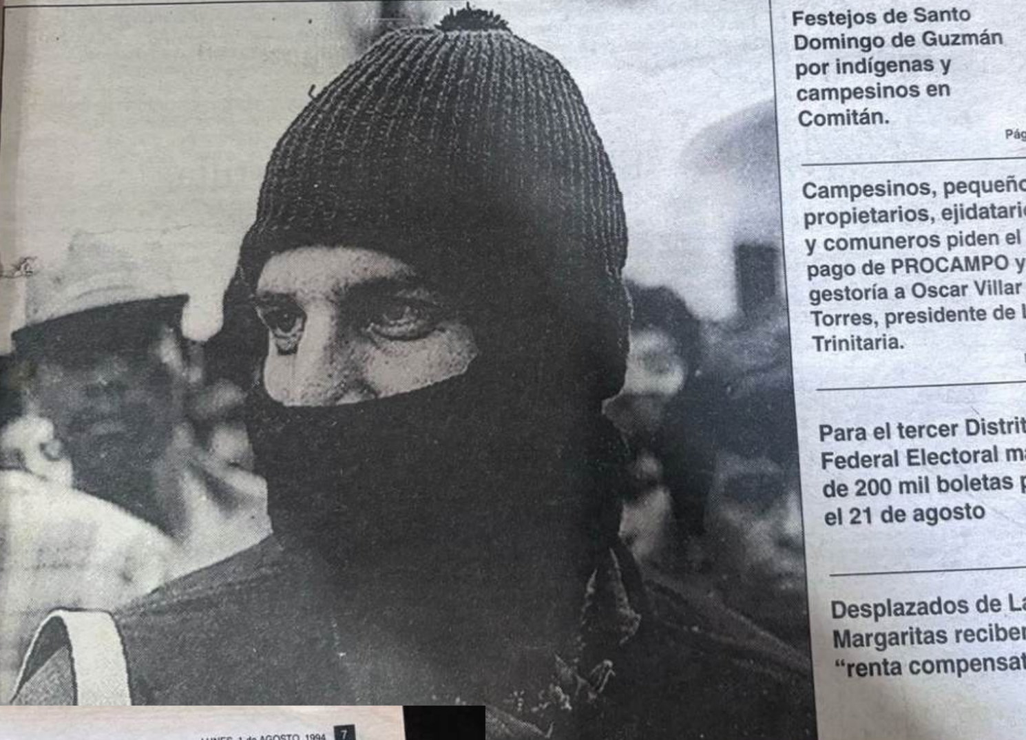
Festivos de Santo Domingo de Guzmán por indígenas y campesinos en Comitán. Pág. 5