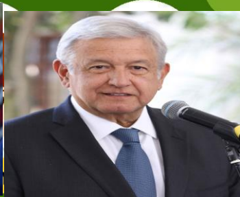
Cónyuges: Andrés Manuel y Beatriz Gutiérrez Müller