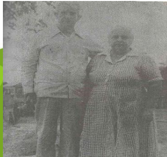
Abuelos de Andrés Manuel López obrador, Esteban Obrador Mayol y Felipa Revuelta López de Ampuero.