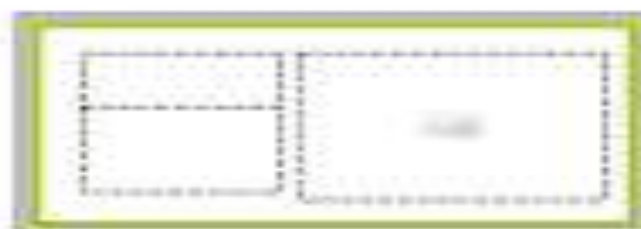
Imagen con leyenda