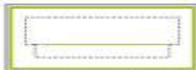
Encabezado de selección