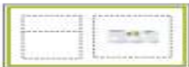
Contenido con leyenda