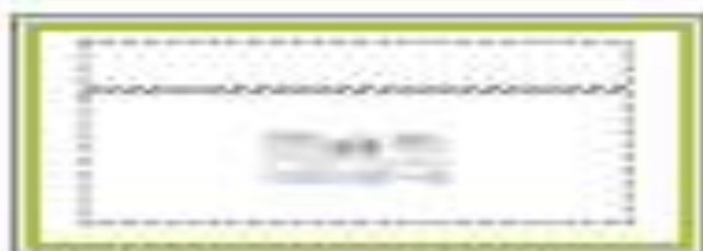
Título y objetos