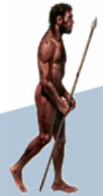
HOMO SAPIENS SAPIENS

Eran más grandes que los seres humanos actuales y poseían una cavidad craneal superior. Fabricaron herramientas más sofisticadas, realizaban rituales, curaban enfermedades y tenían un lenguaje para comunicarse.