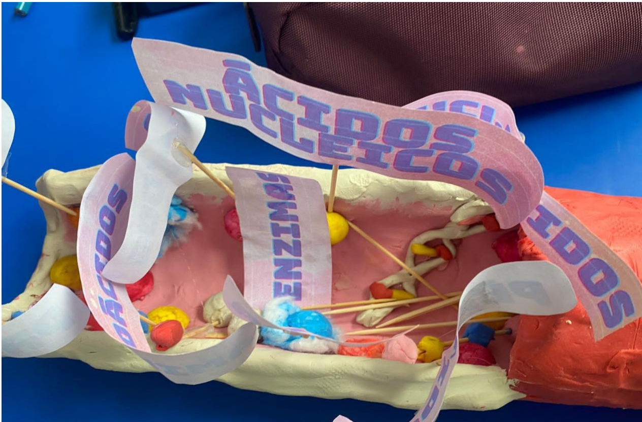
1A. Maqueta de Arteria