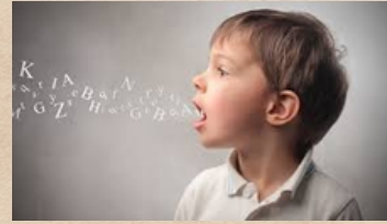
Desarrollo del lenguaje