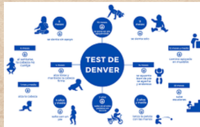
Cuestionarios y escalas de desarrollo