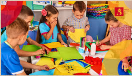
Desarrollo social y emocional