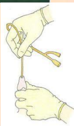
Sondaje temporal y permanente en el varón

3-revisar que la sonda este bien fijada en el muslo de acuerdo al sexo del paciente