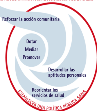
CARTA DE OTTAWA PARA LA PROMOCIÓN DE LA SALUD

La primera conferencia internacional sobre la promoción de la salud reunidos en Ottawa el día 21 de noviembre de 1986 emite la presente CARTA "salud para todos en el año 2000."