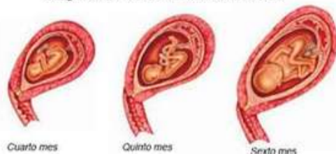
Segundo trimestre de embarazo