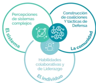
Los elementos claves del Liderazgo Sistémico