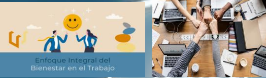
Enfoque Integral del Bienestar en el Trabajo

Esta capacidad permite a los líderes entender mejor las interconexiones dentro de sus organizaciones