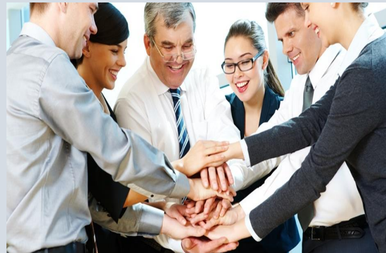
Democrático o participativo

El líder tiende a involucrar a los empleados de “rango inferior” en la toma de decisiones. Además, es él quien los alienta a que participen a la hora de decidir acerca de los procedimientos, objetivos, metas de trabajo, etc.