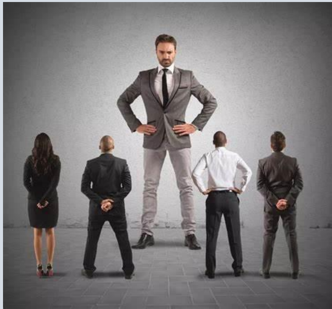
Autocrático o Autoritario

Esta clase de líder tiene centralizada la autoridad, limitando la participación de los empleados y tomando las decisiones unilateralmente.