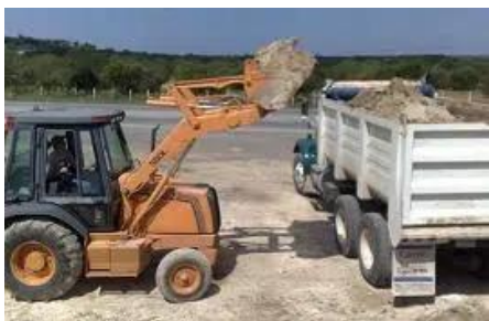
Acarreo de escombros