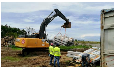
Acarreo de Materiales