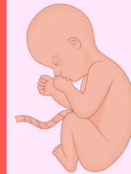
Octavo mes de embarazo

El bebé pasa la mayor parte del día durmiendo, así que cuando está despierto tiene mucha energía y está muy alerta a todo lo que sucede en su entorno. Al escuchar ruidos fuertes, sus reflejos de protección hacen que extienda los brazos y las piernas como mecanismo de defensa. Si bien sus pulmones ya están formados, aún no puede respirar por sí mismo