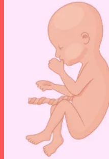
Quinto mes de embarazo

Es probable que tenga bastante cabello sobre su cabeza y sus uñas ya alcanzan la punta de sus dedos. El desarrollo físico está prácticamente completo y ahora el pequeño se dedicará a engordar