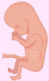
Tercer mes de embarazo

Comienza la cuenta regresiva para el parto. A partir de la semana 37, el bebé ya está desarrollado y listo para nacer. Casi desapareció el vello que cubría su piel y cuando está despierto mantiene los ojos abiertos y distingue la luz. Al nacer, el pequeño podrá respirar por sí solo y succionar. Ahora mide entre 49 y 52 centímetros; su peso oscila entre los 3 y 4 kilos