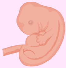
Segundo mes de embarazo