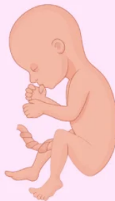
Sexto mes de embarazo