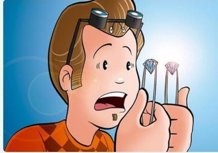
These are original. Estos son originales.