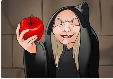
This apple is mine. Esta manzana es mía.