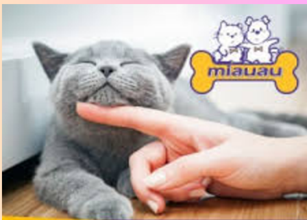
Ciclo Estral de Felinos!

Consta de varias etapas: Proestro, estro, interestro, diestro, anestro