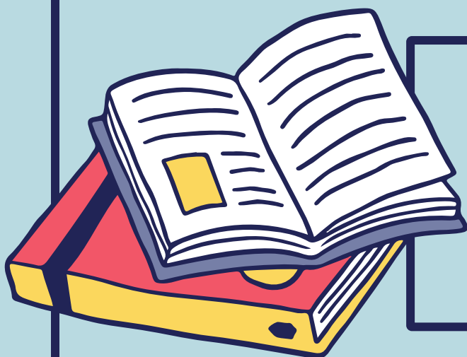
IMAGEN Y CAMBIO DE FORMATO