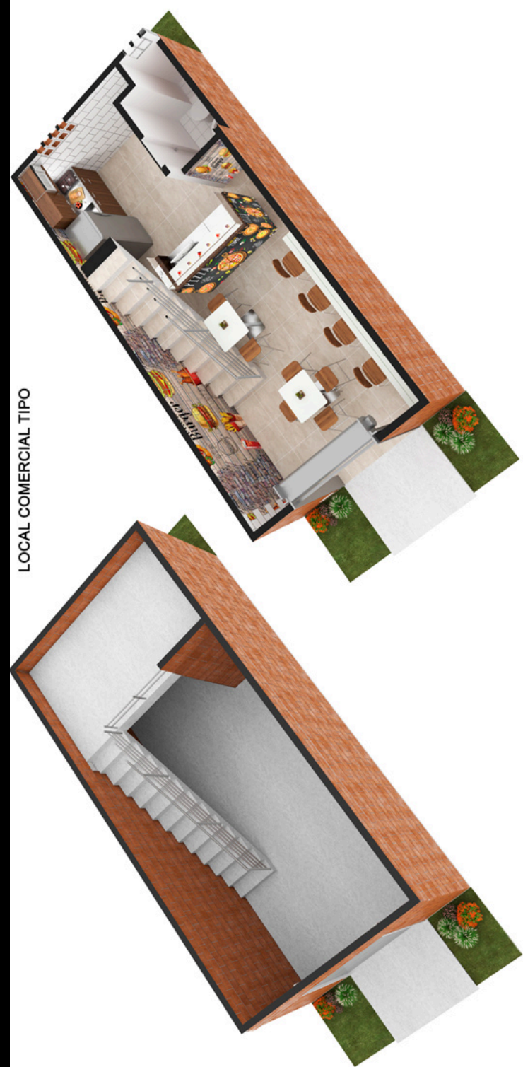
LOCAL COMERCIAL TIPO