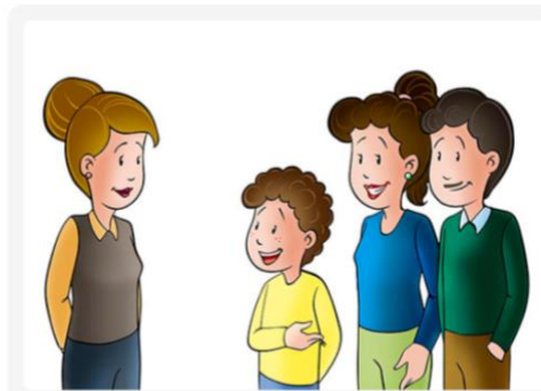
Hello Miss, these are my parents. Hola señorita, estos son mis padres.

Cuando el demostrativo aparece acompañado de un nombre, se categoriza como un adjetivo porque especifica el elemento del que estamos hablando.