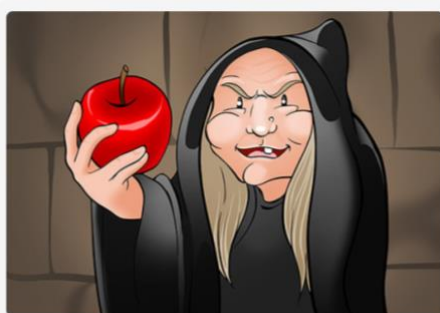
This apple is mine. Esta manzana es mía.

Cuando el demostrativo aparece acompañado de un nombre, se categoriza como un adjetivo porque especifica el elemento del que estamos hablando.