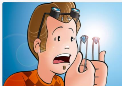
These are original. Estos son originales.