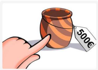
This vase is very expensive.

Se utiliza cuando hablamos de un solo elemento que se encuentra a poca distancia del hablante.