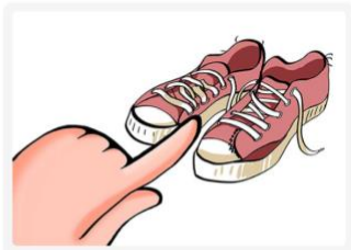
These shoes are old.

Se usa cuando hablamos de más de un elemento que se encuentra a poca distancia del hablante.