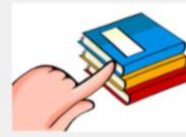
These books Estos libros

También utilizamos los determinantes demostrativos cuando introducimos a alguien o preguntamos por alguien a través del teléfono, utilizando las construcciones This is.../These are respectivamente: