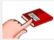
This book Este libro