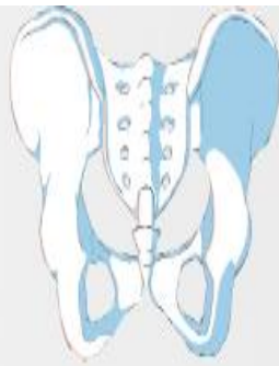
pelvis mayor y menor