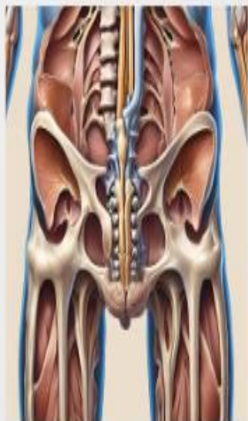
comparacion de pelvis masculina y femenino