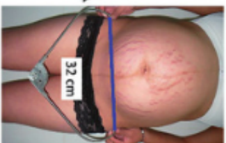
Figura No. 10. DIAMETRO BITROCANTEREO