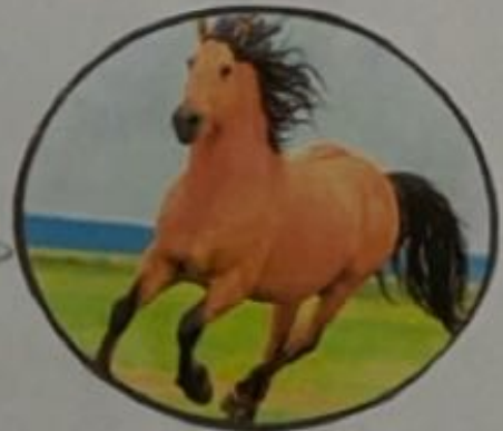
Caballo 4500 a.C. Asia

La domesticación del cerdo salvaje se llevo a cabo en China