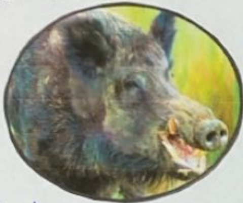
Cerdo Salvaje 4900 a.C. China

Han sido utilizados para la guerra, ceremonias, entretenimiento y como mano de obra.