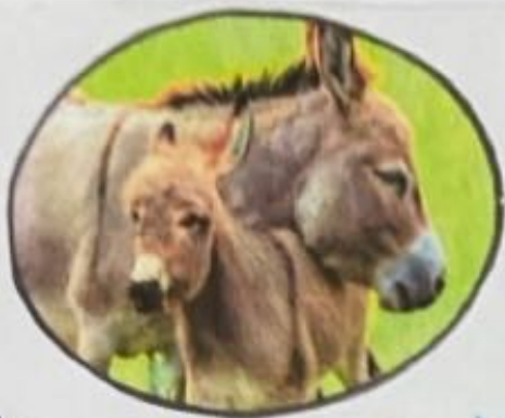
Burro 5000 a.C. Africa

Los pastores de Kenia y el Cuerno de Africa fueron los primeros en domesticarlos.