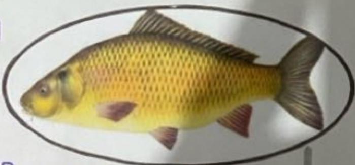
Pez 2500 a.C. China

Su domesticación pudo haber ocurrido en la Cultura Botai, en la región de Akmolá, Kazajistán.