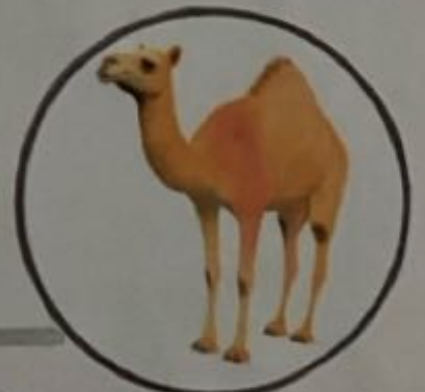
Dromedario 2500 a.C. Asia Central

Los chinos comenzaron el arte de la acuicultura comenzando con la crianza controlada de la Cyprinus carpio .