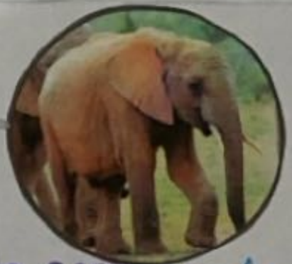
Elefante 5000 a.C. Asia

Los pastores de Kenia y el Cuerno de Africa fueron los primeros en domesticarlos.