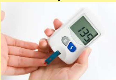
(control de glucemia)

Se planificarán los cuidados correspondientes a cada paciente para las próximas 24 horas