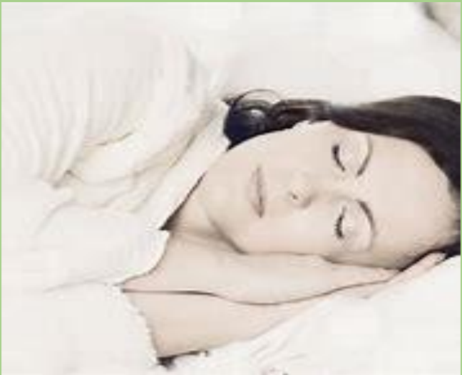
El Poder de los Sueños en terapia Psicoanalítica - Psicóloga en Ciudad de la Costa

Los sueños se consideran como la expresión de los deseos y de las fantasías que por lo general se hurtan a la conciencia.