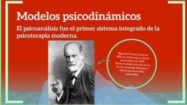
Descubrir 58+ imagen modelo psicodinamico de Freud - Abzlocal.mx