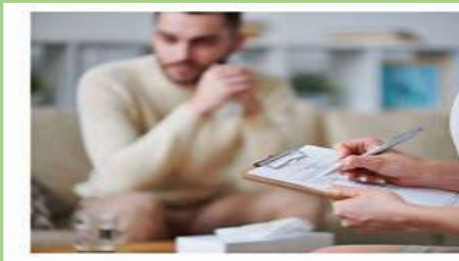
Tratamiento de psicoterapia: qué es y duración | Omega Psicología

ofrecen descripciones de varios pensadores, cada modelo nos describe como se desarrolla la conducta y se vuelve problemática