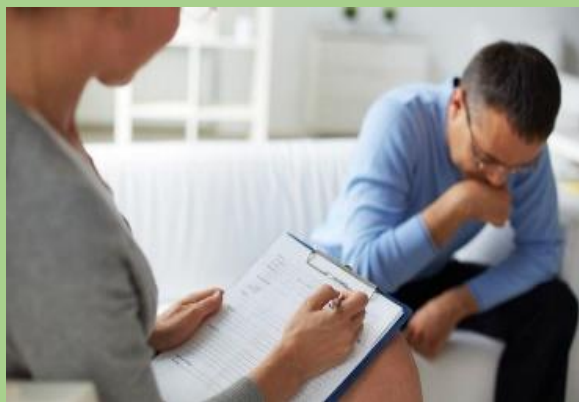
Desensibilización sistemática: qué es, técnica, para qué sirve, ejemplos

El modelo psicodinámico se emplea en una relación de uno a uno, al paciente se le pide que relate todo lo que se le ocurra a lo largo de la sesión.