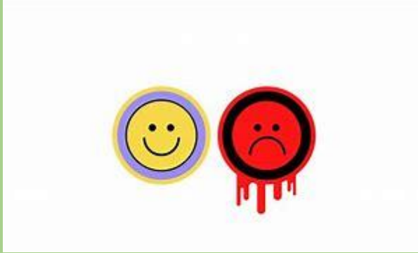
El humor como mecanismo de resistencia - Ethic : Ethic

La relación con el terapeuta y los sentimientos del paciente hacia el constituyen lo que se llama transferencia.