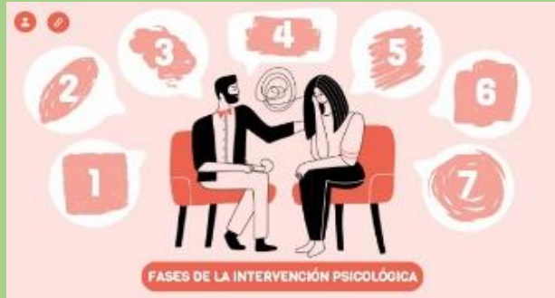
FASES DE LA INTERVENCIÓN PSICOLÓGICA