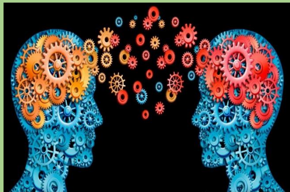
Acto fallido o desliz freudiano: qué es, interpretación y tipos - Curiosoando

La relación con el terapeuta y los sentimientos del paciente hacia el constituyen lo que se llama transferencia.