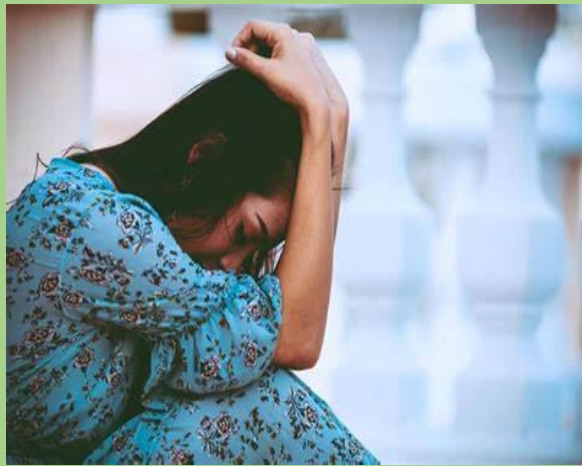
Autocastigo y psicología: el sufrimiento que nos imponemos | Colegio de Psicólogos SJ

RC. Consiste en que el cliente identifique y cuestione sus pensamientos desadaptativos de modo que puedan ser sustituidos por otros apropiados