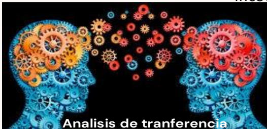
Analisis de tranferencia

freud es el determinismo psicico, la idea de que casi toda la conducta humana se relaciona con los procesos mentales concientes e incocientes o es causada por esta.