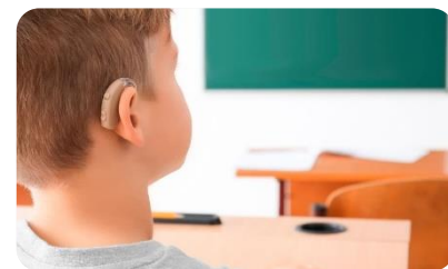
Imagen obtenida: https://formainfancia.com/que-es-discapacidad-sensorial-tipos/

https://www.google.com/search?q=dificultades+de+aprendizaje+fisicas+visuales&esv=2c272caab9e83ec0&rlz=1C1CHBF_esMX1028MX1028&udm=2&biw=1280&bih=58