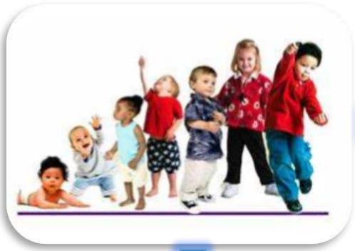
Imagen 1: Primera infancia