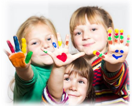
Imagen 2: segunda infancia