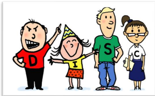
Imagen 5: tipos de comportamiento