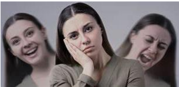
Imagen 4: tipos de conducta