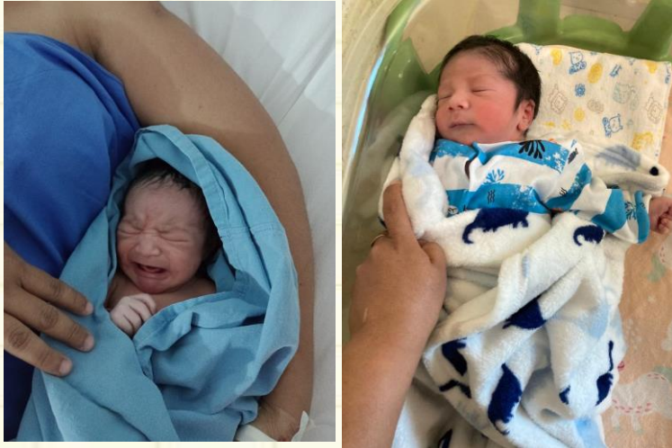
BEBES DE 2 HRS DE NACIDOS