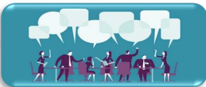
Imagen obtenida: https://www.wipo.int/copyright/es/collective-management.html