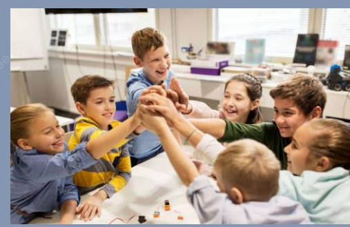
Los miembros trabajan juntos hacia un objetivo común, lo cual nos muestra una conducta cooperativa