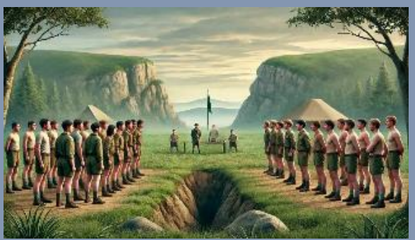
El Estudio de la Cueva de los Ladrones (Robber's Cave) Realizado por Muzafer Sherif (1954) para entender la formación de conflictos intergrupales.