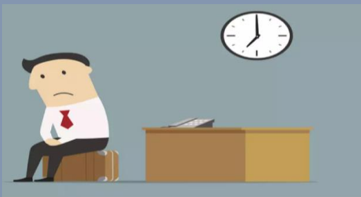
Conducta antisocial