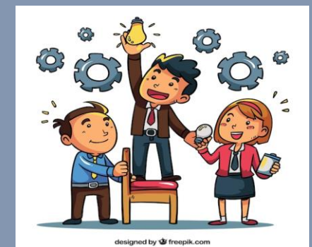
Cada individuo busca maximizar sus beneficios

Los grupos pasan por fases como la formación, tormenta (conflictos internos), normativización (creación de reglas) y desempeño (trabajo eficiente).