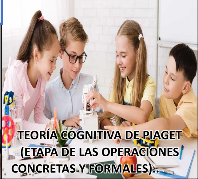
TEORÍA COGNITIVA DE PIAGET (ETAPA DE LAS OPERACIONES CONCRETAS Y FORMALES).