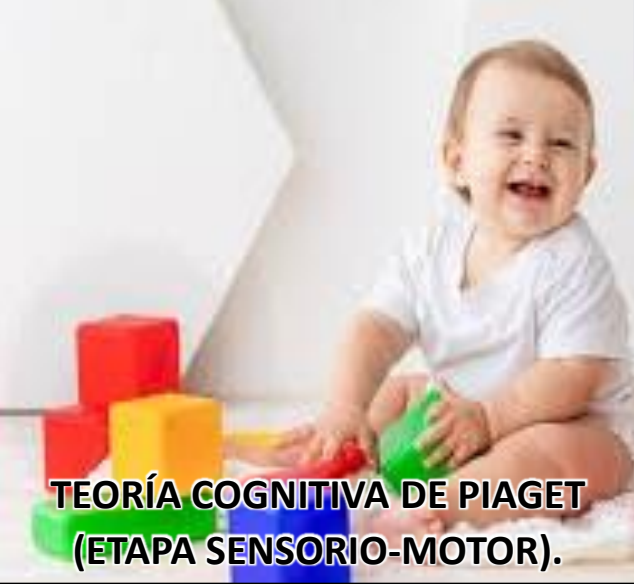
TEORÍA COGNITIVA DE PIAGET (ETAPA SENSORIO-MOTOR).

https://www.actualidadenpsicologia.com/etapa-preoperacional/