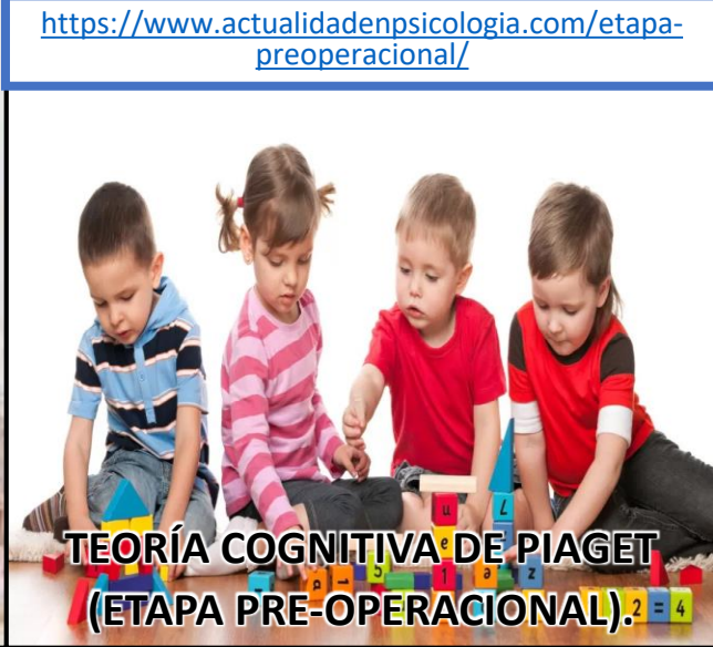
TEORÍA COGNITIVA DE PIAGET (ETAPA PRE-OPERACIONAL).