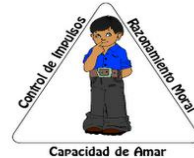
Cimientos del Razonamiento Moral

https://es.slideshare.net/slideshow/valores-y-normas-49814427/49814427