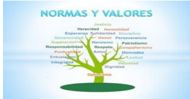
Desarrollo de normas y valores

https://es.slideshare.net/slideshow/valores-y-normas-49814427/49814427