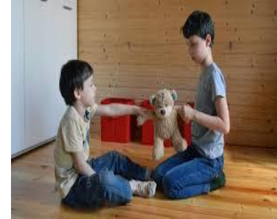
La moralidad de los niños en edad escolar.

https://gomezramos.blogspot.com/2011/10/estadios-evolutivos-del-razonamiento.html