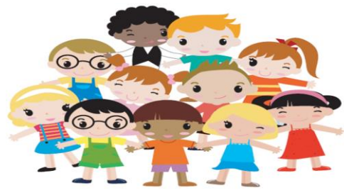
Etapa escolar de 6 -12

https://silviaalava.com/la-importancia-de-los-amigos-en-el-desarrollo-de-los-ninos-y-pautas-para-unas-relaciones-sanas-de-amistad-articulo-en-padres-y-colegios/