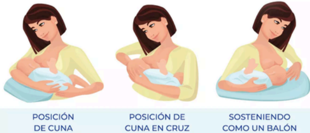
POSICIÓN DE CUNA