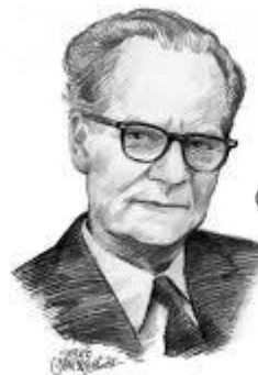
B.F. Skinner el padre del conductismo radical