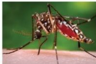
Aedes aegypti aegypti