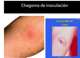
Chagoma de inoculación