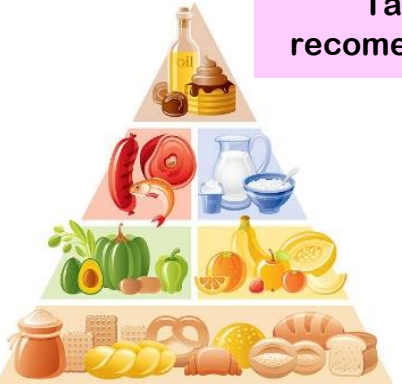
Tabla de recomendaciones

Tabla de composición química de alimentos