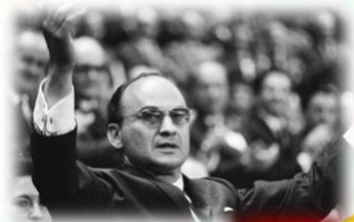
JOSE LOPEZ PORTILLO

Asume el poder en el momento en que el Partido Revolucionario Institucional (PRI) ejerce el dominio absoluto del panorama político de México e inicia una política nacionalista y con una fuerte presencia en el panorama internacional.