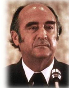
CARLOS SALINAS DE GORTARI

En su periodo, sucedieron hechos como la concertación, la petrolización de la economía, la aplicación de la reforma política inicial para democratizar al país y la primera visita del papa Juan Pablo II. En el terreno económico, durante su gobierno México experimentó, en apenas un par de años, el más alto crecimiento económico nacional en su historia, seguido de una grave caída debida a una política monetarista y una dilapidación de los recursos públicos provenientes principalmente de los excedentes del petróleo.