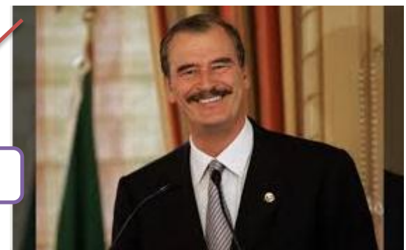
Vicente Fox Quesada