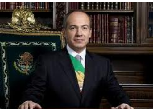
Felipe Calderón Hijo rasa