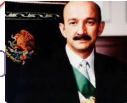
Carlos Salinas de Gortari