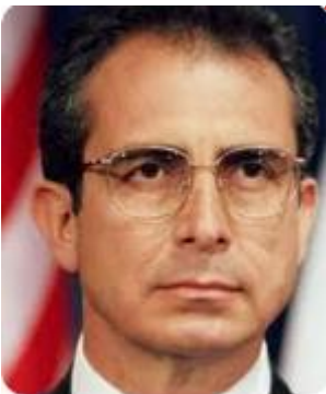
Ernesto Zedillo Porree de León