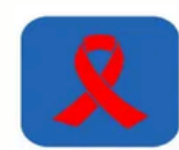
vih - sida