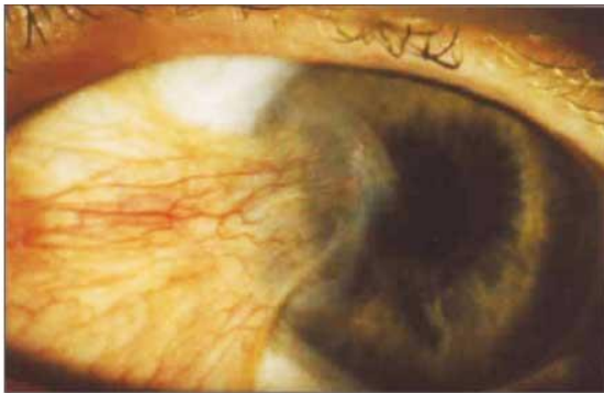
Fig. 1. Pterigion, ojo izquierdo, nasal, que invade córnea.