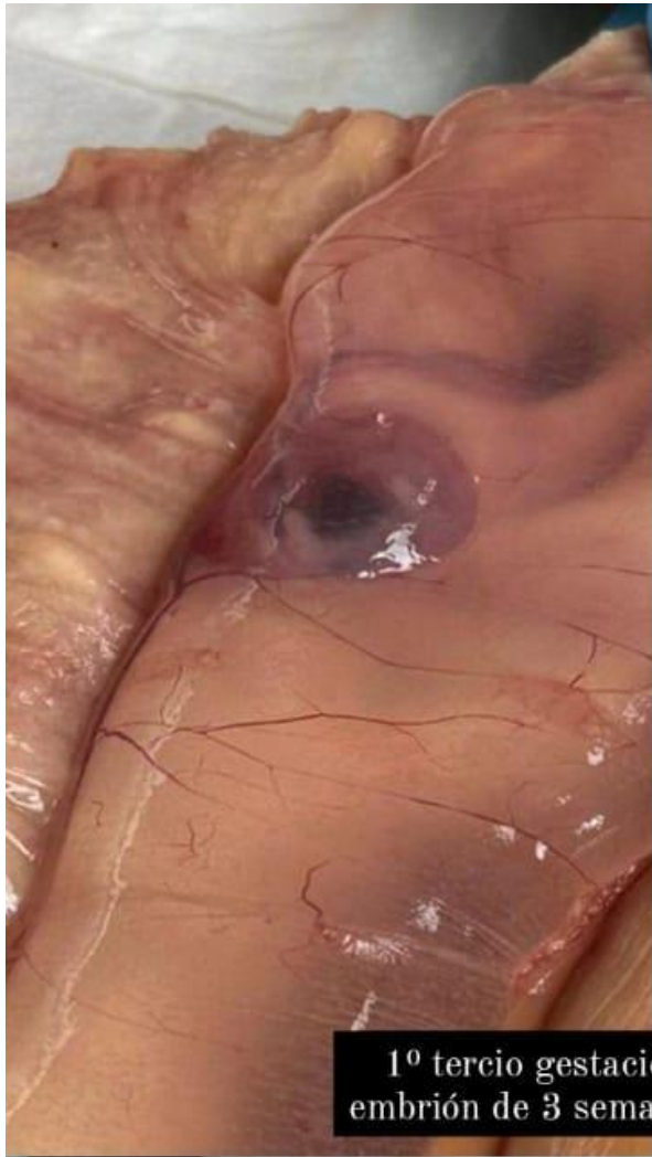
1º tercio gestación embrión de 3 semanas