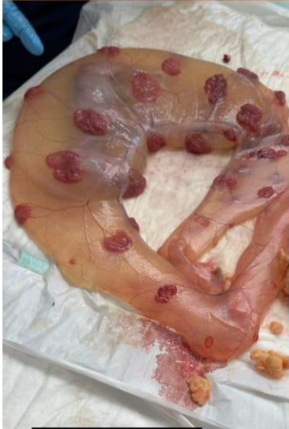
2º tercio gestación Embrión de 3 meses