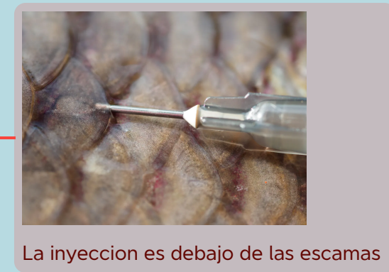
La inyeccion es debajo de las escamas